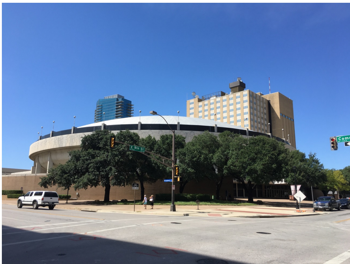
IGARSS が開催されたフォートワースコンベンションセンターの外観

フォートワースは、テキサス州のダラス・フォートワース空港から1時間くらいの距離に位置する都市です。会議期間中は毎日蒸し暑く、青空が広がり、強い日差しが降り注いでいました。その一方で、冷房が心地よく効いた会場では、1週間の間、世界各国から多くの研究者が集まり、活発な議論が繰り広げられました。